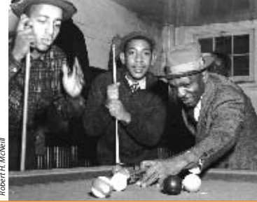
Jugando billar en la calle U, década de los 40

Hasta 1920, cuando Harlem, Nueva York la superó, Washington, DC podía aseverar que poseía la población urbana afroamericana más grande de los Estados Unidos. La zona de la calle U generaba el palpitante del lugar y sirvió de inspiración al genio musical de Duke Ellington. Varios líderes en áreas tan dispares como ciencias, leyes, educación y bellas artes — entre ellos Thurgood Marshall, el Dr. Charles R. Drew, Langston Hughes y Madame Evanti, estrella de la ópera, recorrieron estas calles y elevaron el nivel de aspiración de la comunidad.