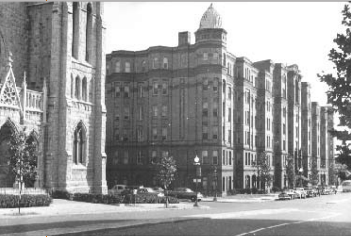
Portner Flats y la iglesia católica St. Augustine, alrededor de 1940.