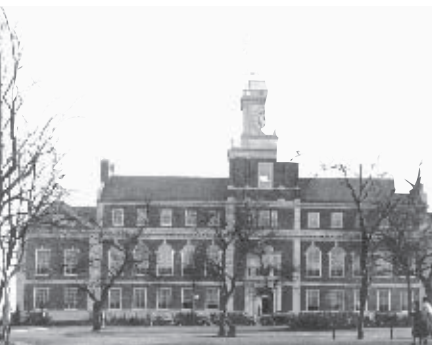
Founders Hall, Howard University

En 1920 había más de 300 negocios de propiedad de afroamericanos en la calle U, el boulevard de la comunidad. Tres cines, clubes nocturnos, salones de baile, billares y tiendas funcionaban próximos a los consultorios de doctores y dentistas negros, donde también había oficinas de abogados negros. En los años 30 y 40, gente de la talla de Cab Calloway, Pearl Bailey, Sarah Vaughn, Jelly Roll Morton y el oriundo Duke Ellington, tocaban en la calle U o en sitios