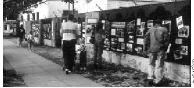
La gente disfruta de la exhibición "Remembering U Street".